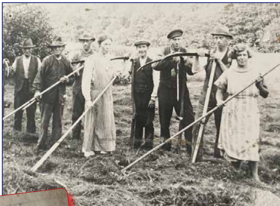
Godsen och de större gårdarna var de enda större arbetsgivarna i norra Halland

Klubben hade också förmånen att ha ett inofficiellt kontor, nämligen Haglunds sadelmakeri