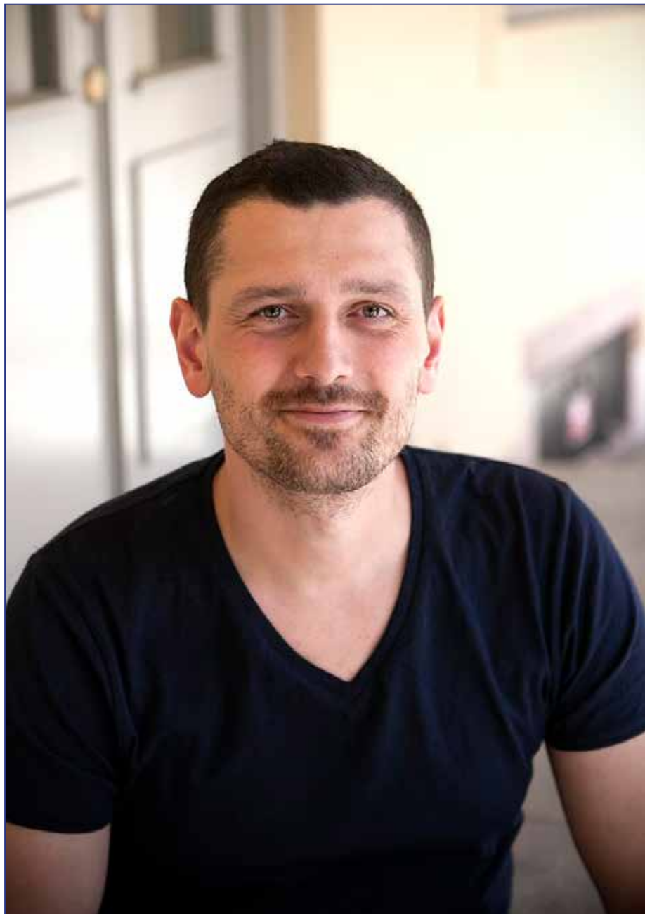
Adnan Dibrani, riksdagsledamot nummer fyra på EU listan för Socialdemokraterna