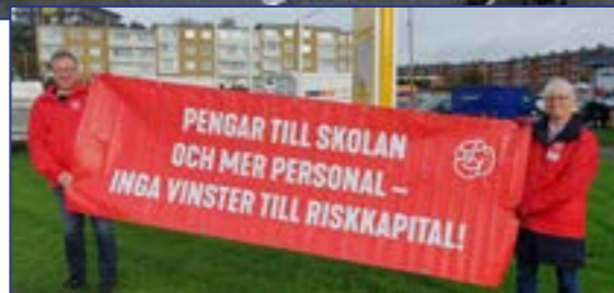
Gerilla 3 okt