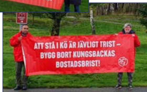
Gerilla 3 okt