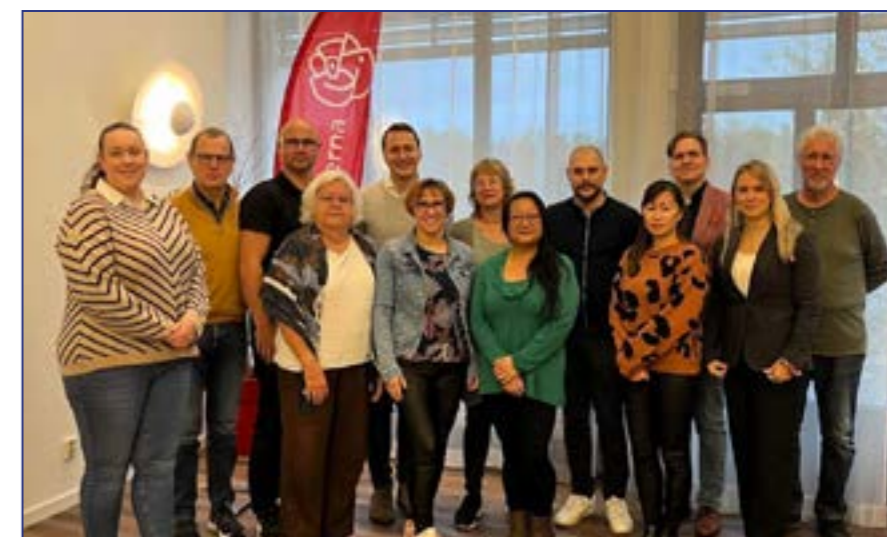
Hallandsrepresentanter på verksamhetsforum