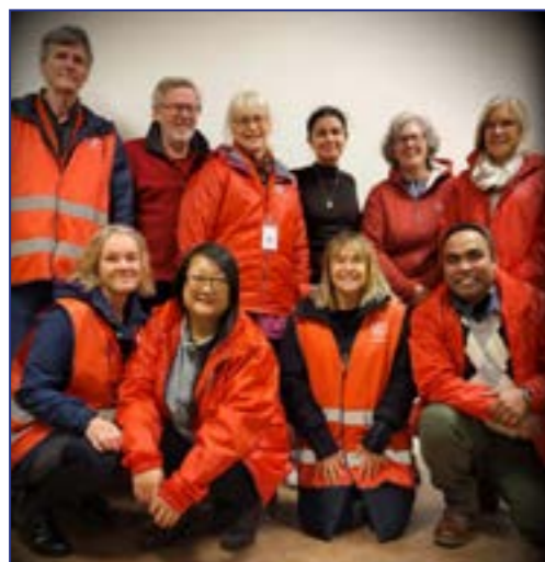
Dörrknackning i Valda. 30 okt