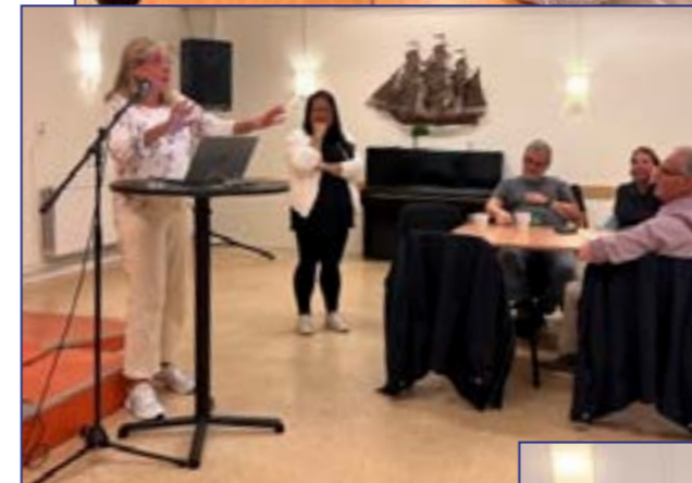
EU-valet nästa år ventilerades

unga är och det ligger olika teman kopplade till olika åldrar. Utmaning med det har varit att både få pengar och logistik för att genomföra det man önskar. Skolorna har ont om pengar och kan tex inte hyra en buss för att komma ut på aktiviteter.