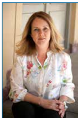
Jennie Nilsson, riksdagsledamot Socialdemokraterna Halland

är kanske svårare men också viktigare än någonsin. Vi ska gå i opposition mot den mest högerkonservativa regeringen i modern tid. Vi ska tvinga dem att bekänna färg i fråga efter fråga. Och vi ska tvinga dem att ta ansvar för den politik de för och för de vallöften som bryts. Men vi ska också utveckla vår egen politik och våra verktyg för att nå ut med den. I det arbetet måste vi alla vara delaktiga. Fokus nu är att ta tillbaka regeringsmakten senast 2026. Det gör vi tillsammans