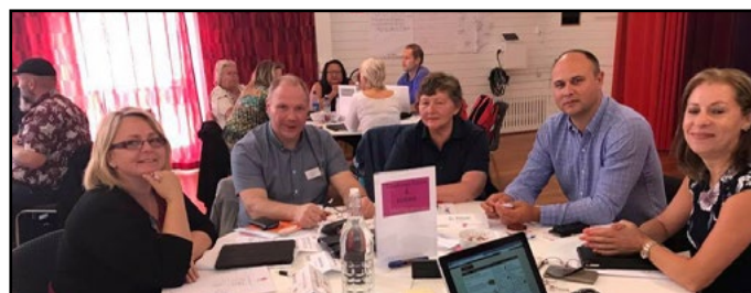
Bild från valledarutbildningen på Viskadalens Folkhögskola